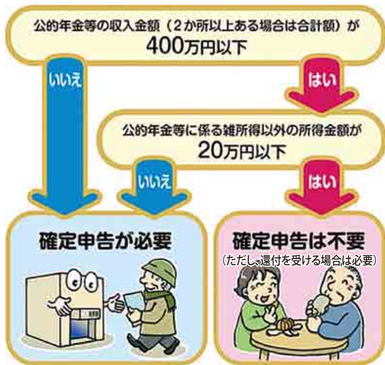
図1. 確定申告の流れ図